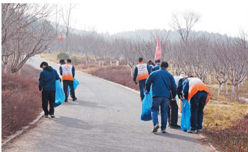
3月，为进一步弘扬“奉献、友爱、互助、进步”的志愿服务精神，以志愿服务为载体深入践行企业社会责任，中国重汽集团各二级单位积极响应集团公司号召，陆续开展2025年“学雷锋志愿服务月”系列活动，用新时代志愿行动赓续雷锋精神内核。